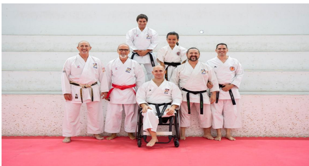
Selección Parakarate Tecnificación FKCV