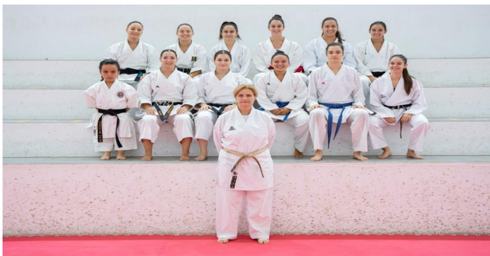
Selección Masculina Tecnificación FKCV