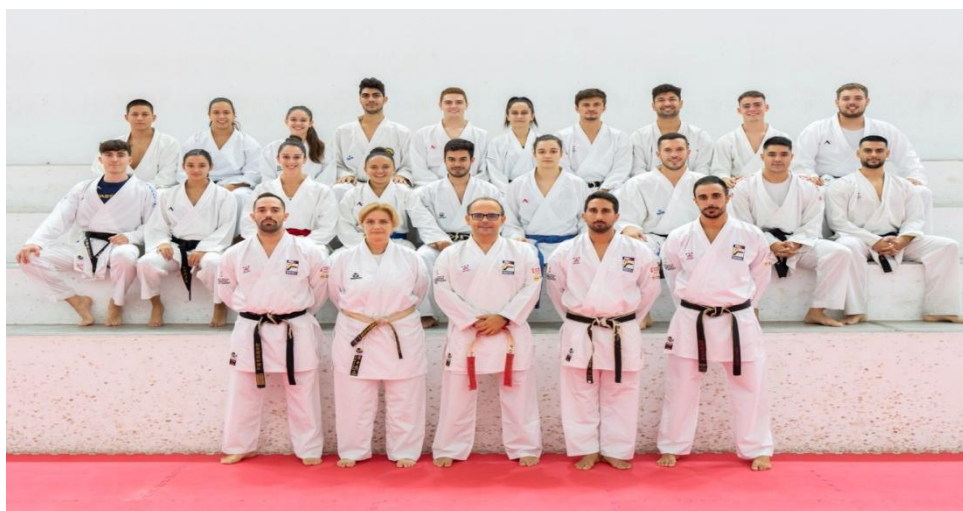
Selección Femenina Tecnificación FKCV